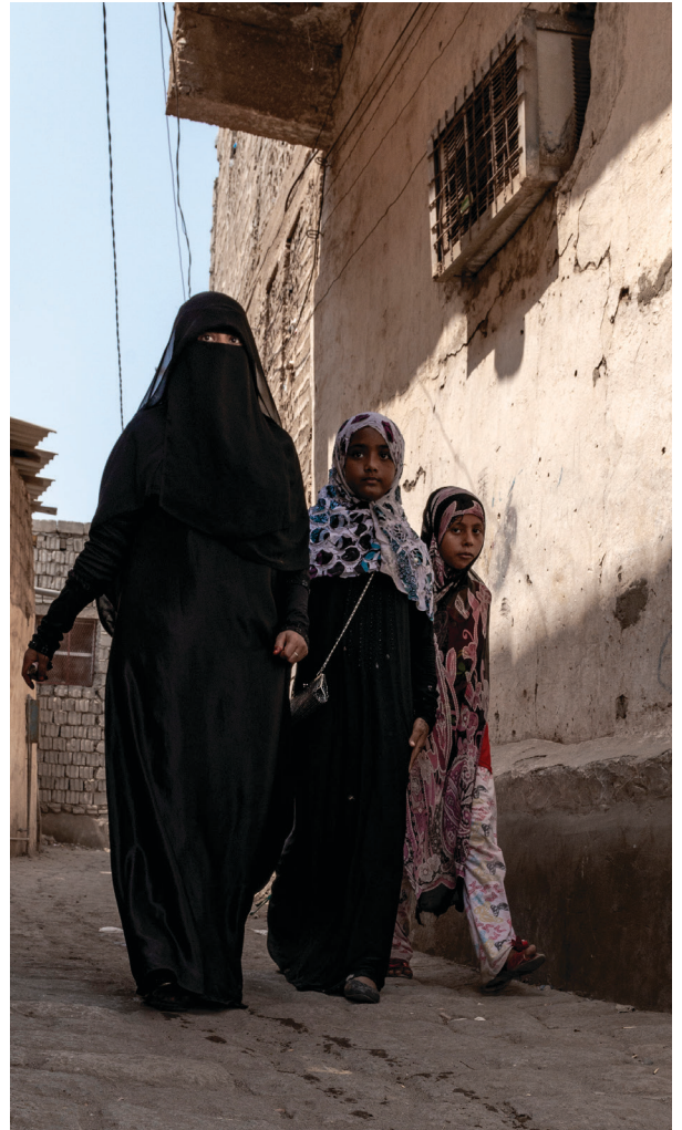
Yemeni woman with her daughters

今年，我們將把也門和埃及阿拉伯人加入翟輔民計劃，請登入 cmacan.org/jaffray 了解更多。